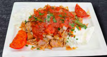
09 Iskender Drehspieß 16,00 Euro