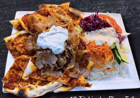
18 Türkische Pizza Teller 15,00 Euro