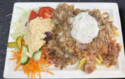
06 Drehspieß Teller 15,00 Euro