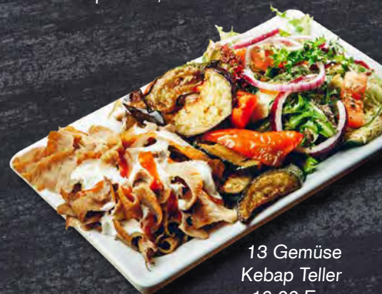
13 Gemüse Kebab Teller 16.00 Euro

Drehspieß Kalb A,F,I,5; Kalbfleisch (90%), Flüssigwürze, (Trinkwasser, Paniermehl ( Weizenmehl , Salz, Gewürze, Hefeextrakt) Soja eweiß, Speisesalz, Gewürze ( Sellerie ), Geschmacksverstärker E621, Stabilisator E450, E451, Verdickungsmittel E407, E460, Emulgator E471, Säureregulator, E262. Würze, Zucker, Dextrose, Glukosesirup, Maltodextrin, Reismehl, Kartoffelstärke, modifizierte Stärke, Aroma) kann Spuren von Gluten ( Weizen ) enthalten.